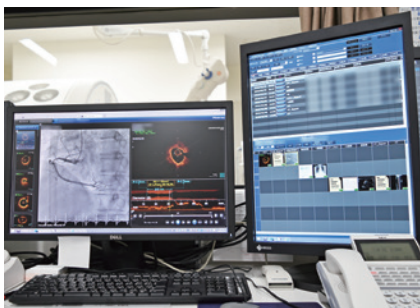
▲右モニター下半分が“マトリクスビューワ”検査結果をクリックすることで、左のモニターにビューワが瞬時に立ち上がる

「レポートの運用に関しては、当院では計測値等数値を主体として書き上げていく循環器系のレポートがほとんどで、日本語の記述が主となる放射線科のシステムは当院には向いていないと考えていました。アンギオ、心エコー、CT検査に関しても当院では心臓カテーテ